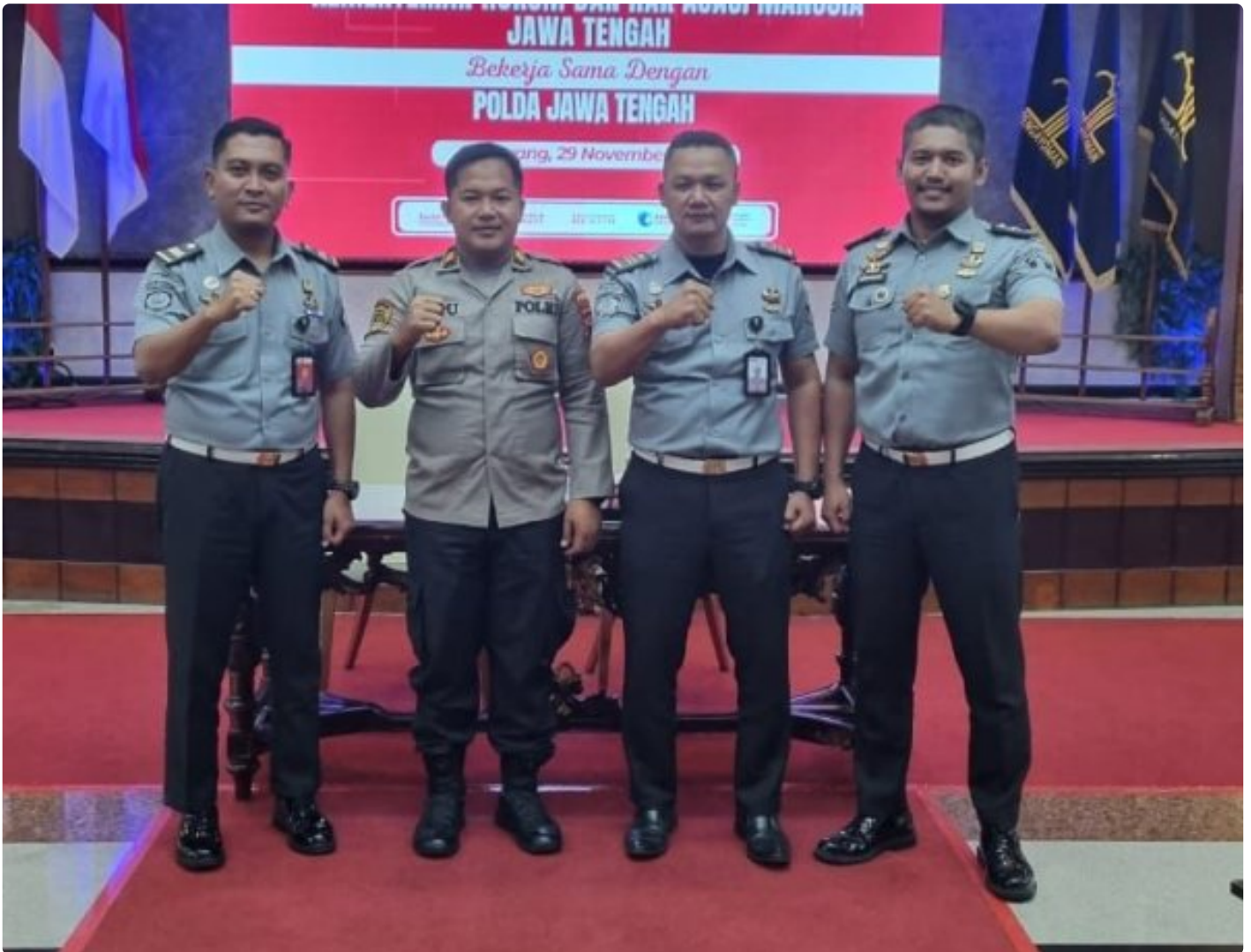
Dapatkan Senjata Less Lethal, 3 Petugas Rutan Surakarta Ikuti Tes Psikologi